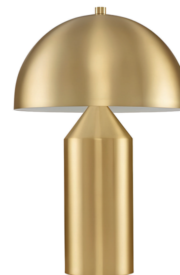
Marvin Tavolo E27