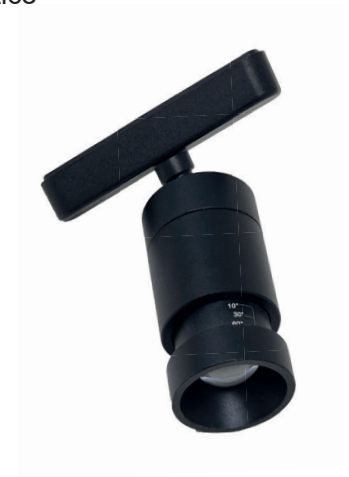
Zoom proiettore da binario magnetico