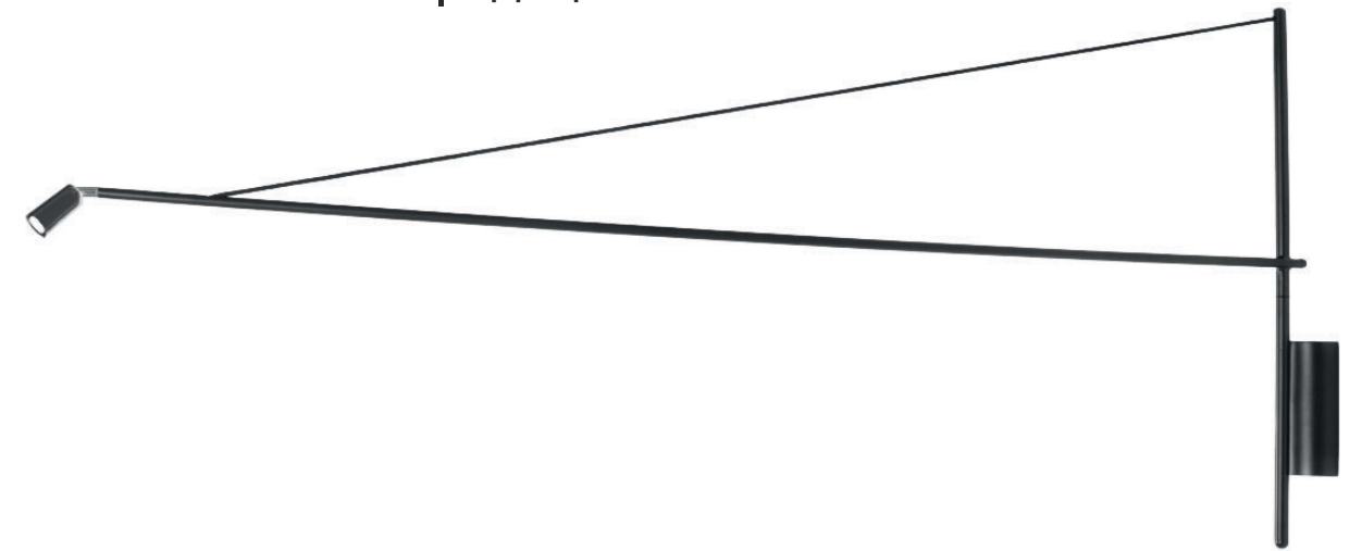
Bussola IP65 applique