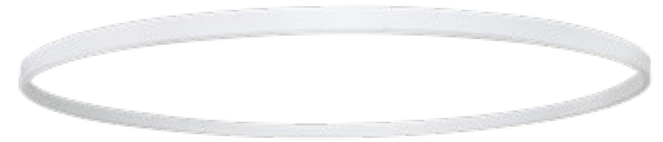
Nettuno mini sospensione 600mm