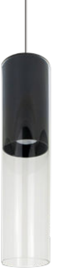
Pandora a sospensione