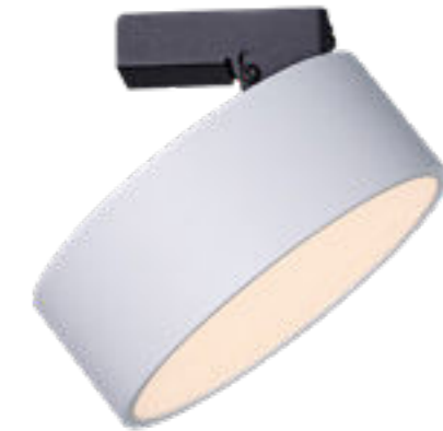
Casper proiettore da binario