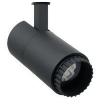
Pippo proiettore da binario