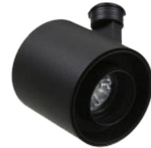
Carioca proiettore da binario