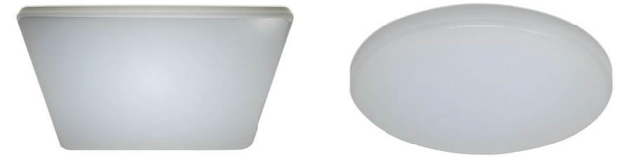
Plan square plafone