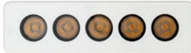
Pluto 3 incasso