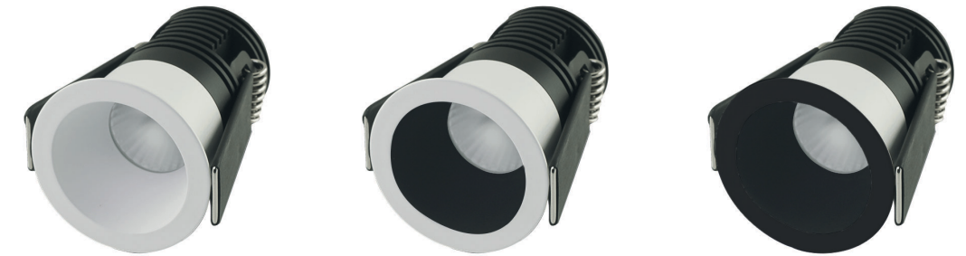
Cleo incasso arretrato