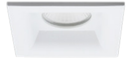
Dendo round incasso